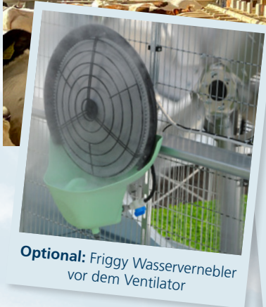
Optional: Friggy Wasservernebler vor dem Ventilator